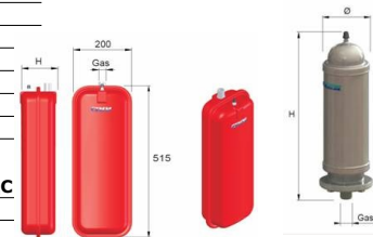
RP 6-12 L.