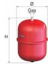
ERE 6 – 24 L.