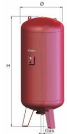
ERE 750 – 1500 L.