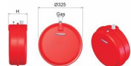
CP 6-12 L.