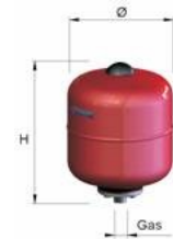
SOLAR CE 12 – 24 L.